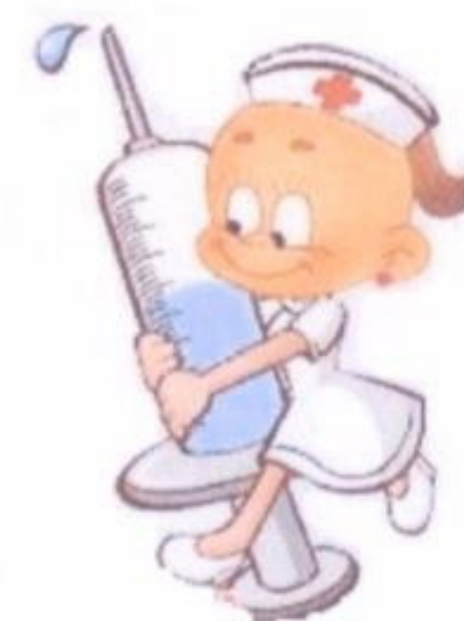
ГРАФИК РАБОТЫ ФАКУЛЬТАТИВОВ по общеобразовательным дисциплинам специальность 34.02.01 «Сестринское дело» 1 курс 2017-2018 учебный год